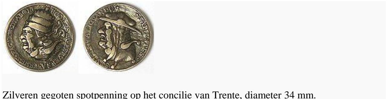
Zilveren gegoten spotpenning op het concilie van Trente, diameter 34 mm.

De protestanten waren niet zo gelukkig met het concilie. Al van voor het begin werden door onbekende medailleurs spotpenningen gegoten, waarvan hier een rond 1550 gegoten zilveren exemplaar is weergegeven.