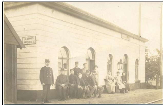
Het spoorwegstation van Grammene.