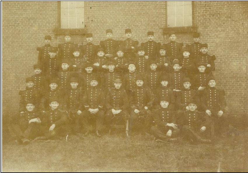
Rijkswacht of burgerwacht (civiele bescherming avant la lettre?).