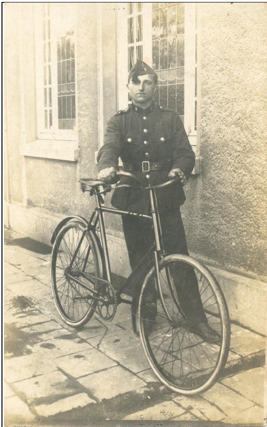
rijkswachter of soldaat te fiets ?