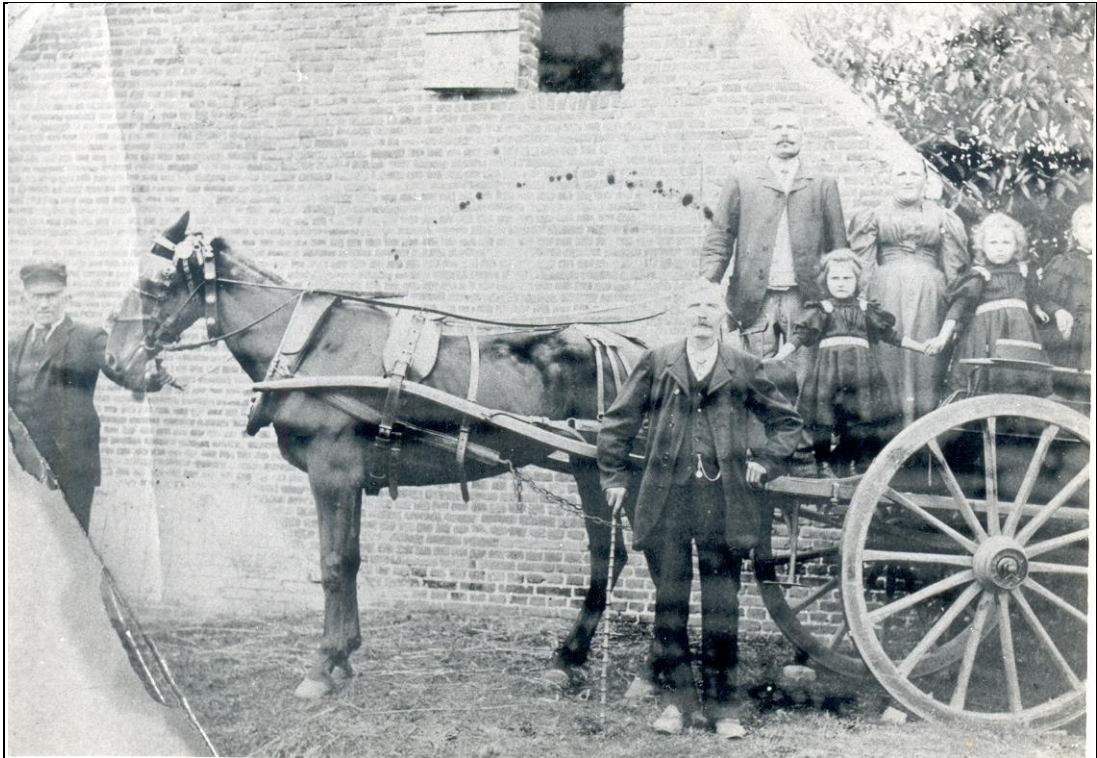
Eén of andere stoet ?